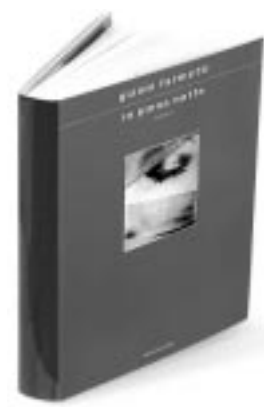
Gianni Farinetti In piena notte Mondadori, pp. 304, € 16,40 ROMANZO

Il punto di vista non muove, cioè, dal ritorno di un passato mai risarcito e magari dall'urgenza di cercarne il senso impossibile, ma invece da una sorta di misericordia delle cose. Il ricordo delle due donne (sia della madre che ha patito la doppia perdita del marito e del figlio, sia dell'amica che spiritosamente l'ha sempre sostenuta e ancora la sostiene) getta su tutto una patina di vissuto che ha ormai riscattato ogni dolore. Il ritorno sui luoghi di una sofferenza che è stata acuta diventa il riconoscimento di una saggezza che i ritmi della vita hanno saputo equilibrare tra la memoria e l'oblio. Le nuove esistenze non cancellano quelle perdute, ma ne prolungano il suono. Il vuoto non diventa per questo un pieno, ma al di sopra di ogni umano difetto la pietà ha ormai vendicato gli insulti, il tempo redenti.